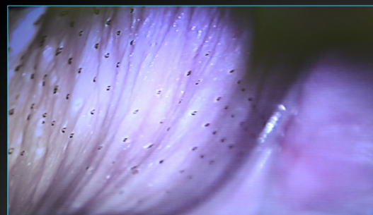
Cara Lateral de la Vagina Post Laser